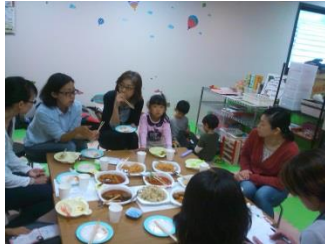
石井食品(株) ランチBOX開発

サポートデスクは、食物アレルギーの取組をされている企業と消費者をつなぐ役割も果たしています。新商品の開発に伴う、モニタリングもその一つです。2015年度は、(株)濱田、石井食品(株)、全農コムックス(株)の商品開発のお手伝いをさせていただきました。新しい商品が、市場に登場するのがとても楽しみです。