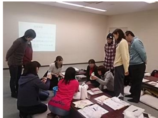
南丹市での視察風景