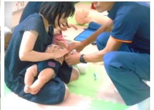
乳児・小児救急講座

つどいの広場を昼間に過ごす第2の我が家のようにリピートする利用者は多いものの、一般の乳幼児の保護者の食物アレルギーへの理解はまだ浅く、サポートデスクとの共通イベント「地蔵盆」「ハローウィン」「クリスマスパーティ」などに利用者の参加を取り込むことがほとんどできませんでした。サポートデスクを利用する食物アレルギー当事者との間にはまだまだ距離があります。しかしながら、広場で受けた食物アレルギー相談は相談全体の約45パーセントと半数近く(38/86件)を占めており、市内他34か所の広場と比較すると大変高い割合となっています。今後は食物アレルギーをもっと身近に感じてもらえるような内容をプログラムに盛り込み、食物アレルギーへの理解が自然な形で浸透していくよう、社会的理解の場として食物アレルギーに配慮したびいちゃんねっとらしい、かけはしの役割を担うつどいの広場へと成長していくことが課題です。