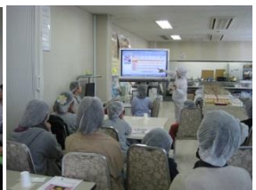
石井食品(株)工場見学