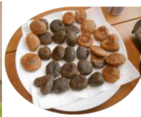
黒米&赤米せんべい