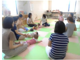
赤ちゃんの柔らか抱き方教室