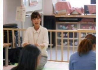
赤ちゃんの健康教室