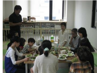
(株)濱田 梅を使った商品開発