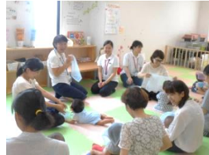
保育士さんといっしょ