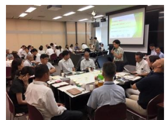
京都府 NPO リレーションズ

防災事業については、これまであまり積極的な取組をしてきていませんでした。2015年度は、舞鶴や木津川の出張学び舎で要望が多かったことがきっかけで、本格的な取組をスタートしました。事業の実施にあたっては、「自助・共助」の大切さを伝えていくことに重点をおき、京都府内で活動を展開されている防災士の方に協力いただきました。アレルギーの有無に関わらず、日頃からの「備え」は必要ですが、その大切さや被災地での実際の様子を伝えていただいたことで、受講者だけでなく私たち職員も、改めて防災事業の大切さを学びました。