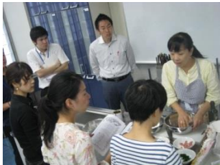
舞鶴市での視察風景

2日目にはいったプラットフォームでは、京都市内で実施しているアレルギー大学、サポートデスクで実施しているアレルギーの学び舎、京都府域で開催してきた出張学び舎の各講座に、自治体・子育て支援団体が視察・見学できる仕組みをつくり、実際の様子を見て、どんな対応が必要なのかを検討することになりました。各地域（京都市・舞鶴市・木津川市・南丹市）で、多くの方々に視察・見学をいただき、参加者には支援対策へのアンケート等にご協力いただきました。