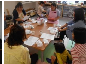
レシピ紹介と栄養のお話